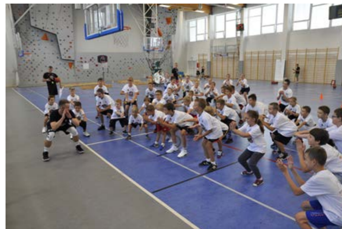
Trening na hali sportowej