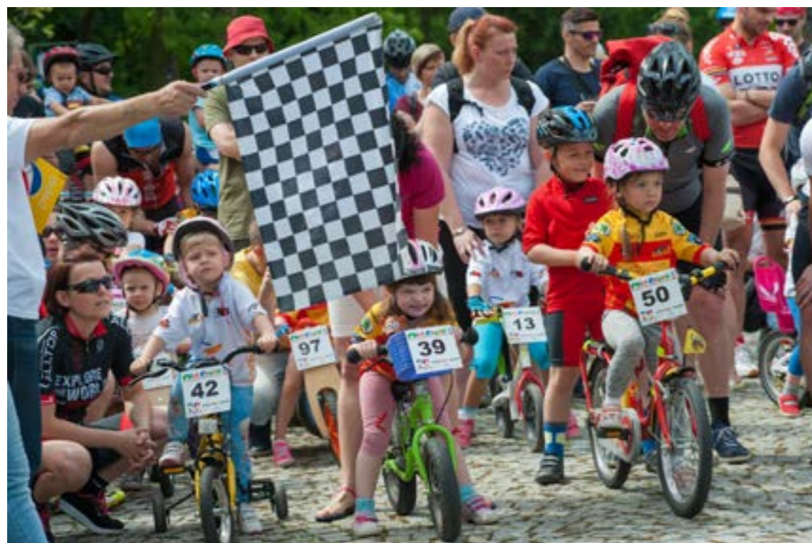
Czym skorupka za młodu