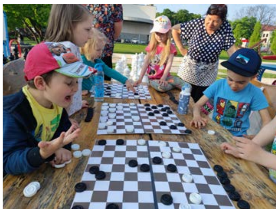
II MIEJSCE Sięgaj, gdzie wzrok nie sięga