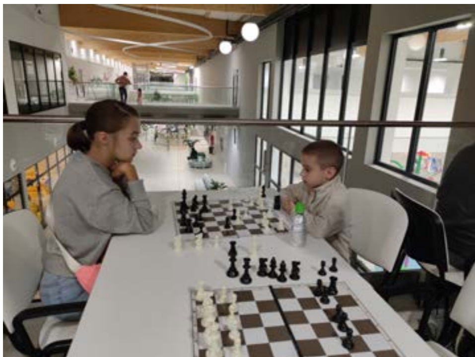
Jak ty zbięś tę damkę

Koszykarka, tenisistka i warcabistka amatorka. Magister ekonomii. Społeczniczka. Jako rodzic zaangażowana w tematy oświatowe i sportowe.