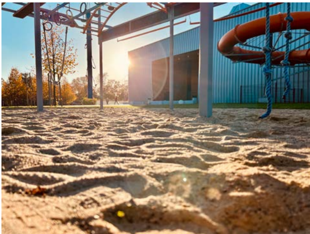
Sport na zewnątrz czy wewnątrz

Lubi pokazywać nietuzinkowe ujęcia miejsc, które znamy i mijamy codziennie. Cały czas poszukuje inspiracji, aby przedstawiać swoje zdjęcia w ciekawy i interesujący sposób. Od urodzenia jest mieszkańcem Błonia. To miasto ciągle go zaskakuje.