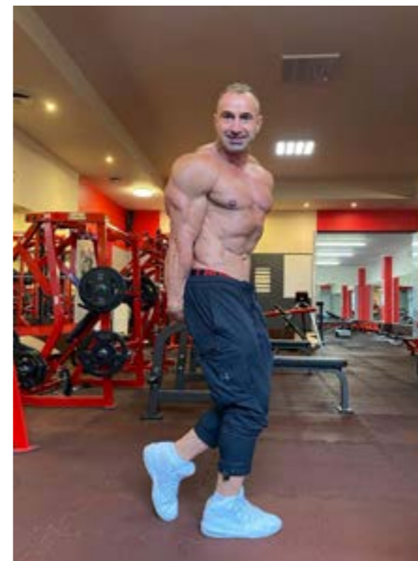
Kulturystyka – podążając za perfekcją

Fotografią zajmuje się amatorsko od roku. Swoją pasję odkryła podczas wakacyjnej podróży do Grecji. Najbardziej lubi uwieczniać swoich najbliższych oraz przyrodę. Inspiracje czerpie również na siłowni. Zachwyca ją przemiana ludzkiego ciała, co stara się pokazywać na swoich zdjęciach. W wolnych chwilach oddaje się czytaniu książek – to jej druga pasja. Ulubiony gatunek to thriller psychologiczny.