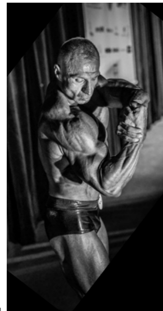
Kulturystyka – podążając za perfekcją