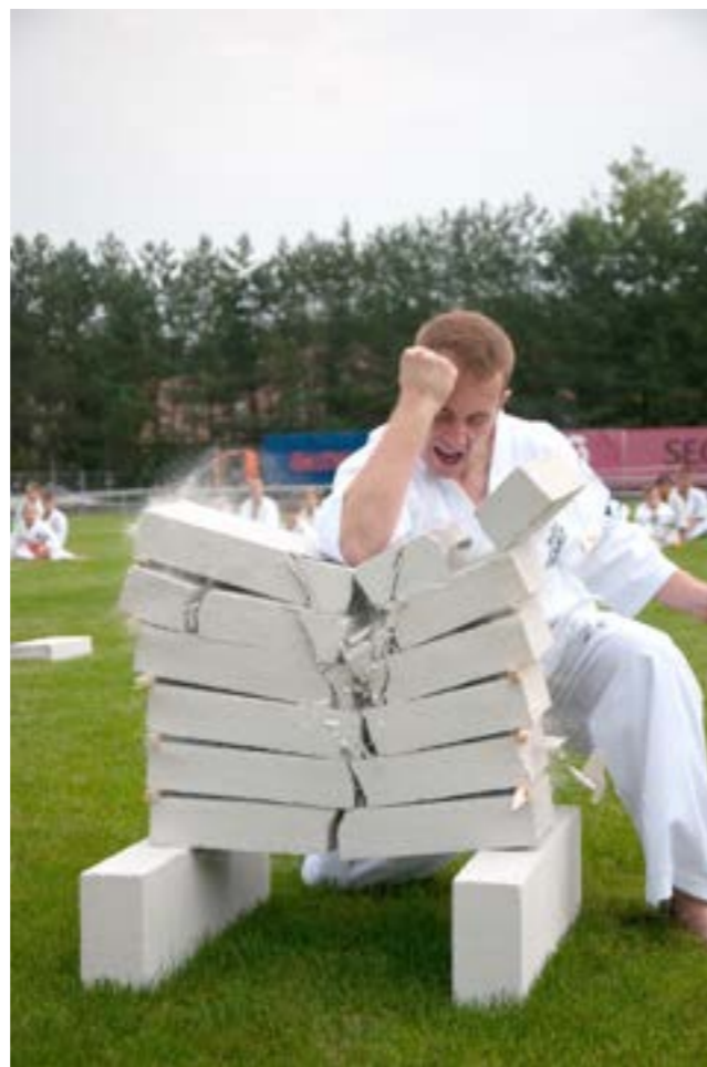
To jest uderzenie

Swoją radością fotografowania dzieli się z innymi, wystawiając swoje prace w galeriach. Ma za sobą już dwadzieścia pięć wystaw indywidualnych i kilka zbiorowych. Jest przekonany, że to nie koniec.