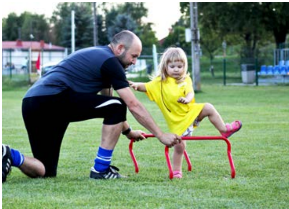
Sport uczy pokonywania przeszkód