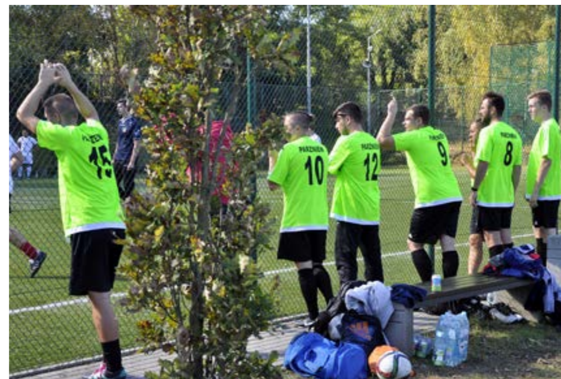
Turniej Sołectw – Orlik

Pracuje od dwunastu lat w Ośrodku Kultury w Brwinowie. Od zawsze fotografuje amatorko wydarzenia kulturalne, sportowe, ciekawostki przyrodnicze, ciekawe zjawiska pogodowe, ludzi i zwierzęta. Nie rozstaje się ze swoim aparatem ani w dni wolne od pracy, ani w czasie świąt czy uroczystości.