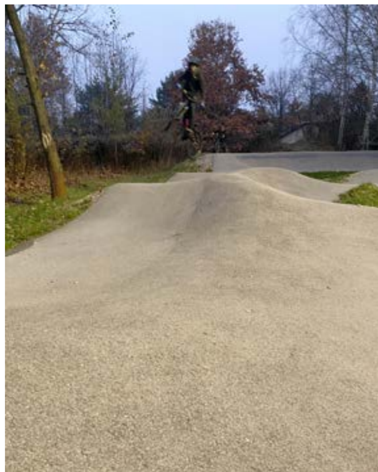
Jak w niebie