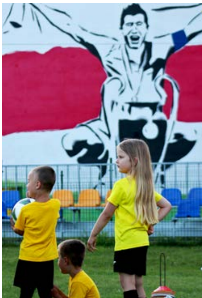
Od skrzata do mistrza świata